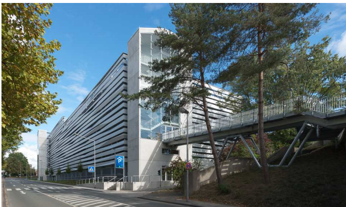
Vue du Sud-Ouest