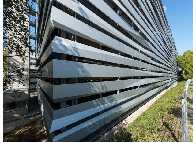
Vue d'un détail à partir du Sud-Est.

AMP a été chargée de concevoir ce nouveau parking sans poteaux intérieurs avec des places de parking d'une largeur correspondante aux normes actuelles. Le concept de la façade fut le résultat d'un concours d'architecture, dont le lauréat fut Hartig Wömpner Architekten, qui sera accompagné sur le plan technique par AMP.