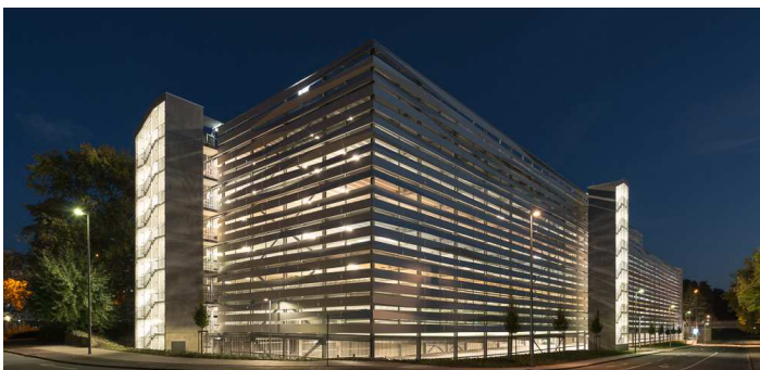
Vue de nuit à partir du Sud-Ouest

Maître d'ouvrage : BLB Bau- und Liegenschaftsbetrieb NRW