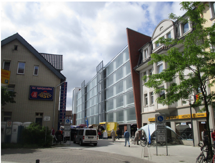
Vue à partir de la zone piétonnière