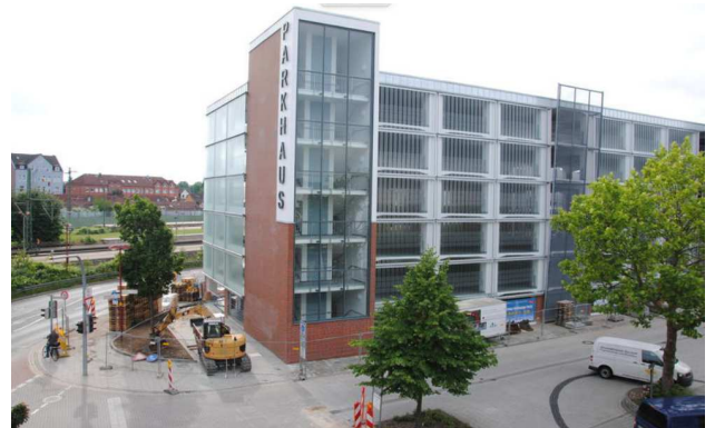
Vue de la Zuckerpassage

AMP a été chargé d'élaborer un concept, un avant-projet ensuite du dossier de permis de construire et enfin de l'élaboration d'un devis descriptif général pour ce projet.