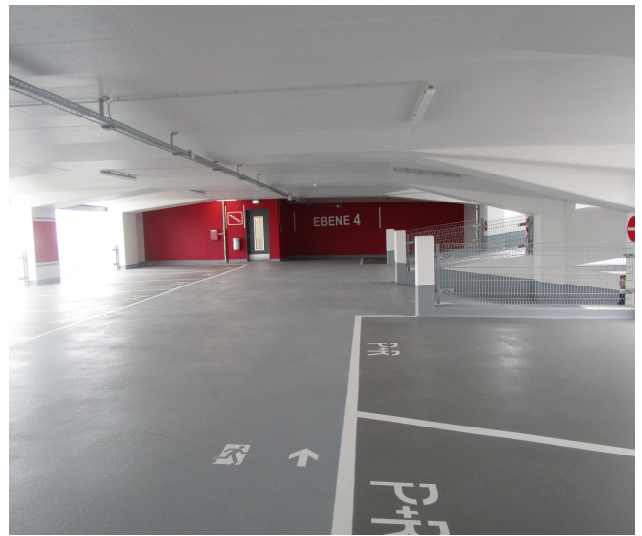
Vue d'intérieur au niveau du niveau de Parking 4