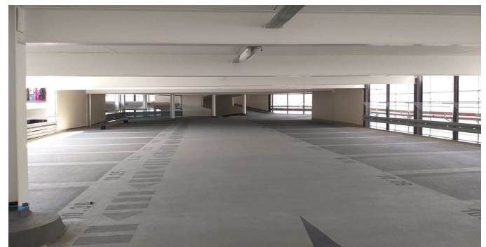
Parkgasse nach der Instandsetzung