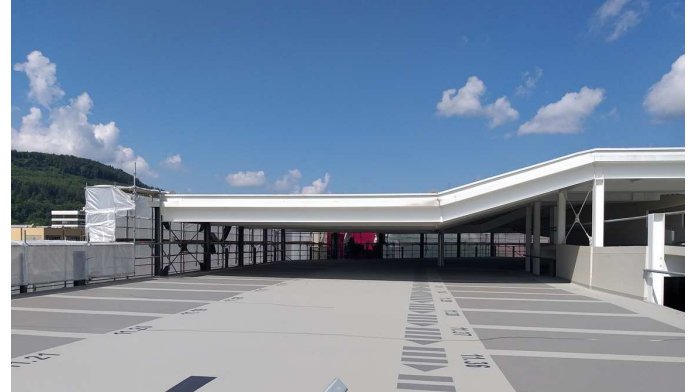
Freideck nach der Instandsetzung