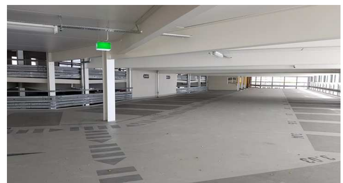
Parkgasse nach der Instandsetzung