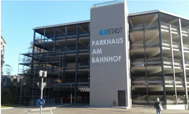
Westansicht mit neuer Ein-/Ausfahrt

Telefon: +49 721 / 98574 - 0 Fax: +49 721 / 98574 - 99 Mail: info@amp-parking.com Internet: www.amp-parking.com