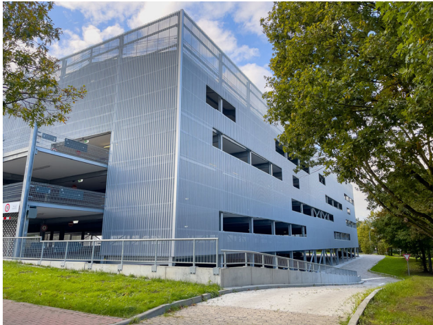
Façade Est

De plus la zone de stationnement sur la quelle a été érigé le Parking vient d'être réhabilité et offre maintenant 344 places supplémentaire. Une installation photovoltaïque est réalisée en toiture.