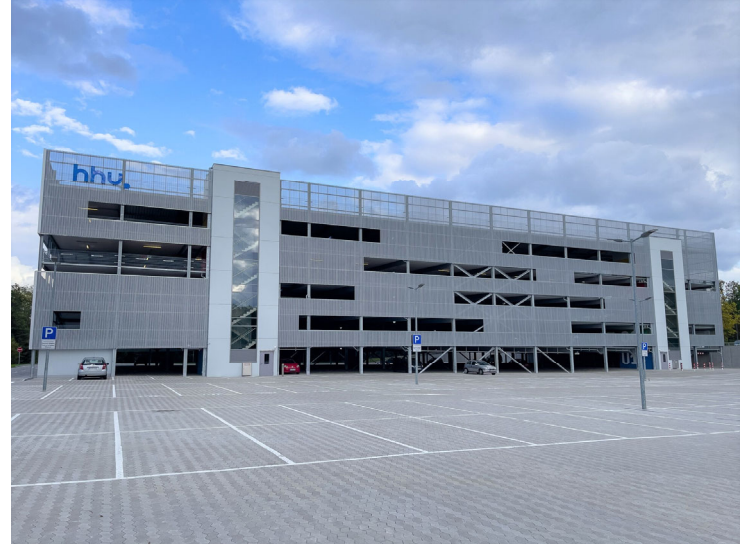
Façade Ouest