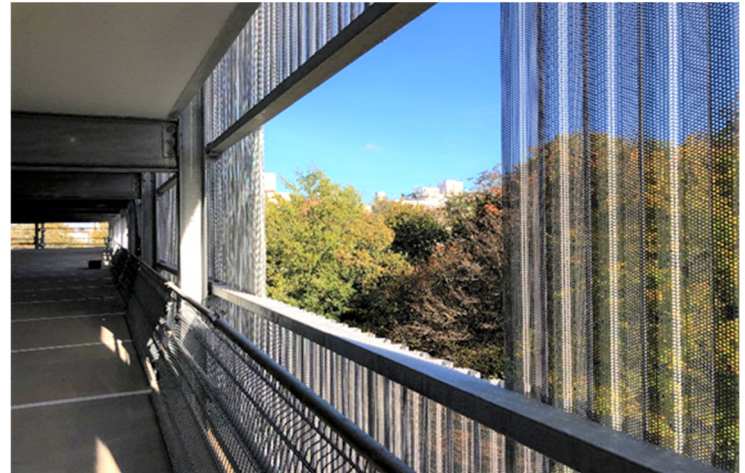
Détail de façade