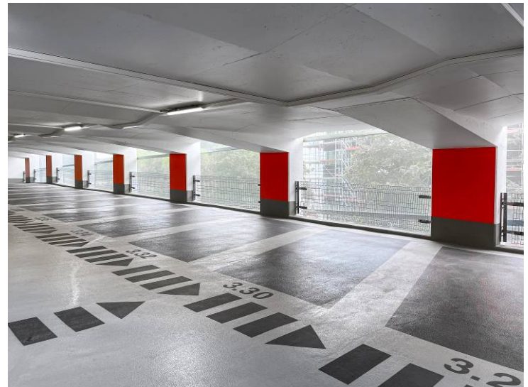
Vue intérieure du Parking