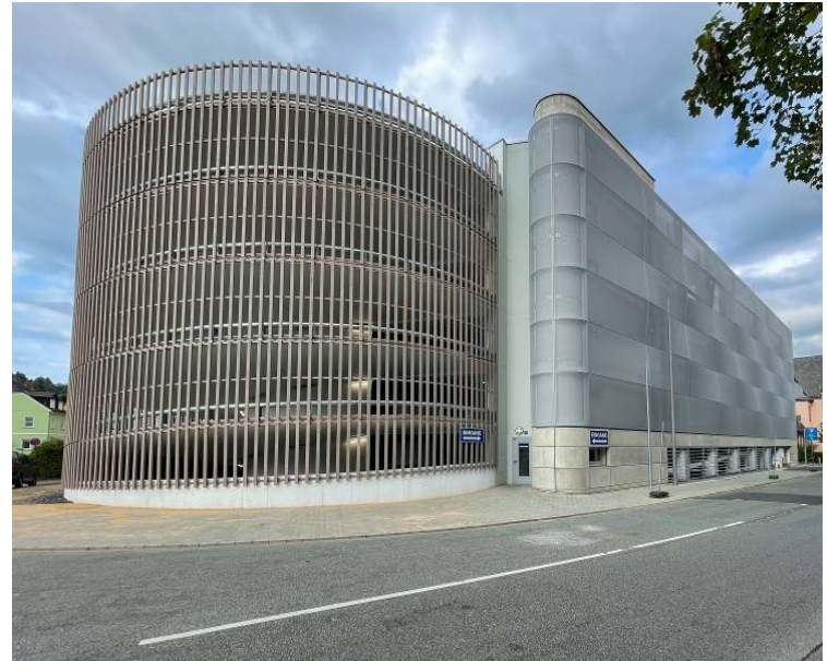
Vue du Sud-Est (Image: Levin Liebmann)

Comme dans la plupart des Parkings AMP, la circulation est à sens unique. Les places de stationnement ont une largeur de 2,50 m et sont disposés en biais pour un confort maximal de l'utilisateur.