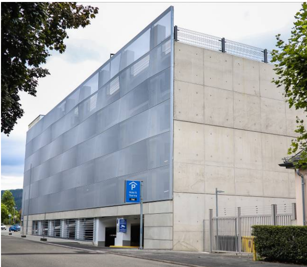
Vue du Sud-Ouest