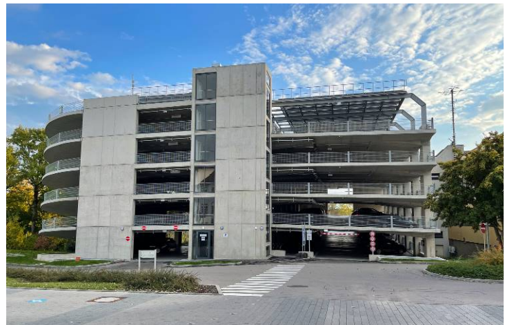
Vue du Nord (Image: Levin Liebmann)