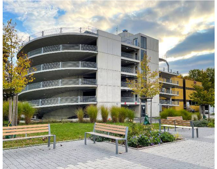
Vue de l'hôpital

L'immeuble de Parking est équipé 8 bornes de charges pour véhicules électriques.