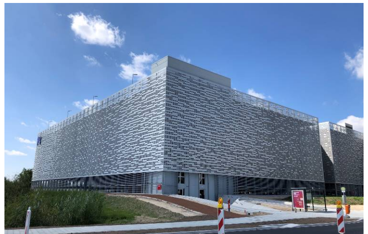
Ansicht von Nordwesten