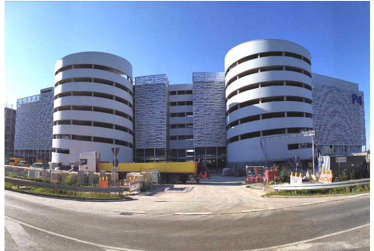
Ansicht von Norden

AMP war mit der Parkhauskonzeption, der Erstellung einer funktionalen Ausschreibung mit Leistungsprogramm und dem technischen Controlling beauftragt.