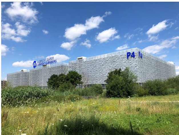
Ansicht von Südwesten