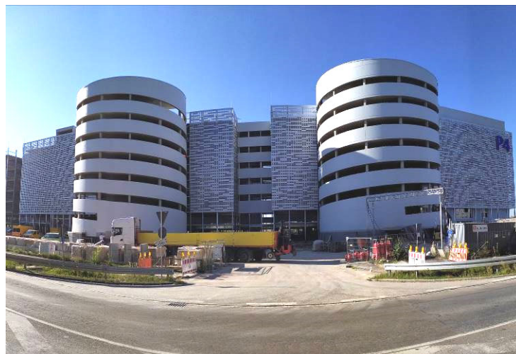
Vue du Nord

AMP a été chargée d'élaborer le concept et le descriptif pour un appel d'offre fonctionnel ainsi que de la mission du contrôle technique.