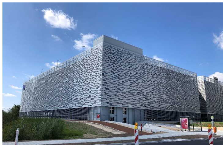
Vue du Nord-Ouest