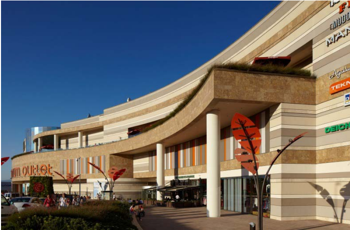
Accès piéton par l'Outlet Center