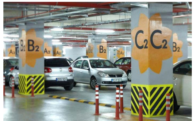
Espaces de stationnement