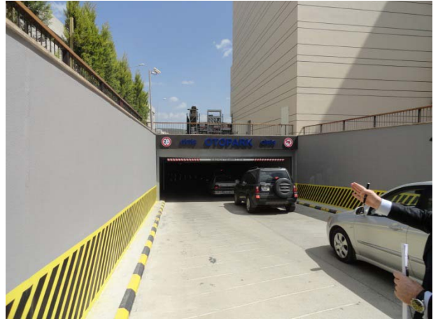
Accès au Parking