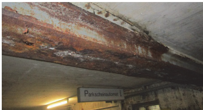
Poutre en acier rouillée avant réhabilitation