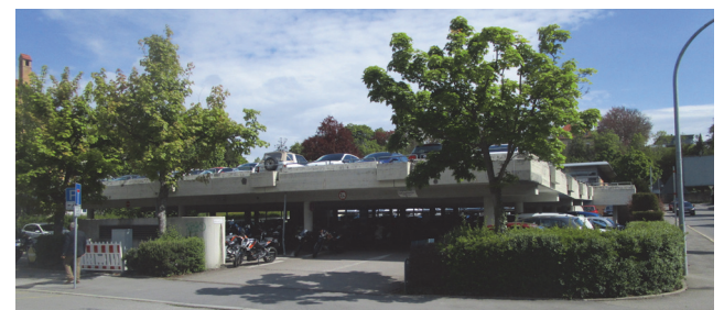
Vue extérieure du parking