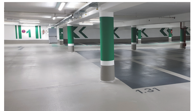
Niveau de sous-sol après réhabilitation