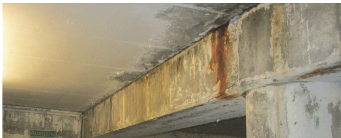
Poutre en béton armé avant réhabilitation