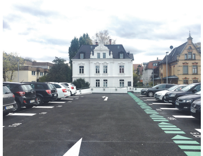
Freideck nach der Instandsetzung

Téléphone: 0721 / 98574 – 0 Fax: 0721 / 98574 – 99 Mail: info@amp-parking.com Internet: www.amp-parking.com