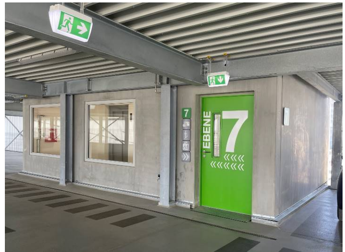
Vue intérieure