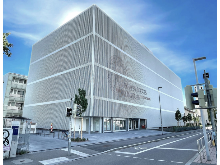
Facade extérieure

AMP a retravaillé comme maître d'œuvre tout corps d'état l'avant-projet, le dossier du permis de construire, le projet d'exécution ainsi que le devis quantitatif et estimatif initial et a été en charge du suivi de chantier.