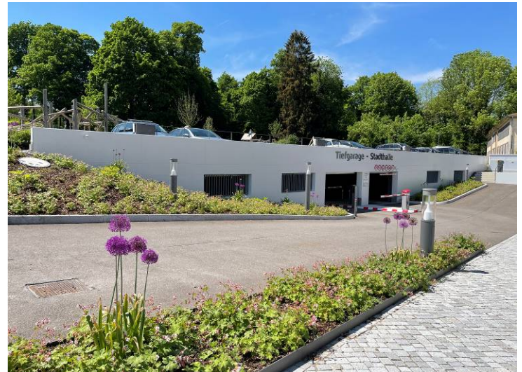
Einfahrt zur Tiefgarage

Die Parkebene besteht aus zwei Parkgassen, an welchen beiderseits der Fahrspur die 2,60 m breiten Stellplätze zur bequemen Befahrbarkeit schräg angeordnet sind.