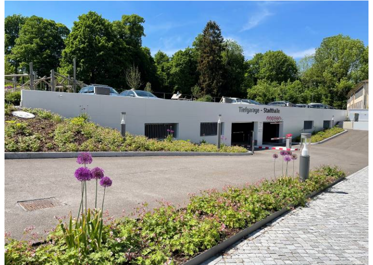
Accès au parking souterrain

Le niveau de Parking contient 2 voies distribuant des deux côtés des voies les places de stationnement d'une largeur de 2,60 m, agencées en biais par rapport à la voie pour offrir un confort augmenté pour l'utilisateur.