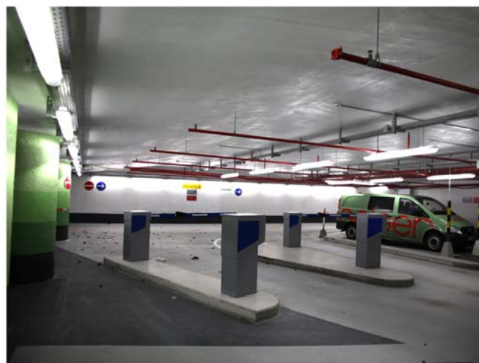
Ausfahrt 1. UG nach der Sanierung