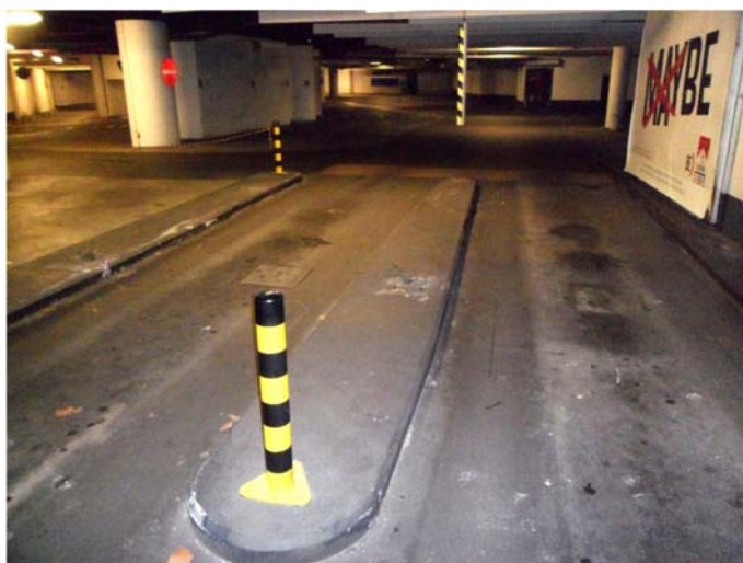
Einfahrt 1. UG vor der Sanierung

Körnerstraße 25 · D-76135 Karlsruhe Telefon: 0721 / 985 74 - 0 · Fax: 0721 / 985 74 - 99