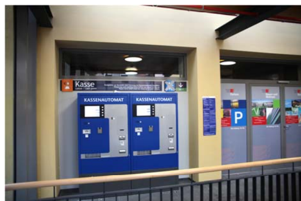
Terminal de paiement au rdc après rénovation

Nombre de places de stationnement : 348 véhicules légers Largeur des places de stationnement: 2,40 m et 2,50 m Angle des places de stationnement : 70 ° et 80 ° Début des travaux de réhabilitation: Janvier 2012 Mise en service partielle (Niveaux -1 et -2) Décembre 2012 Achèvement prévu des travaux: Juin 2013