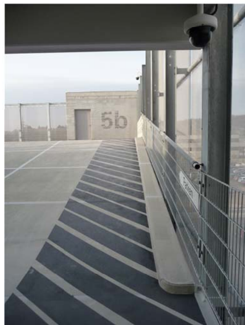
Cage d'escalier Niveau 5

Nombre de places de parking: env. 516 véhicules légers Largeur des places de parking: 2,50 m Angle de stationnement: 90° Début des travaux: Juillet 2012 Mise en Service: Décembre 2012