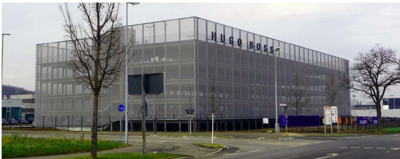
Vue de SUD-EST

Körnerstraße 25 · D-76135 Karlsruhe Telefon: 0721 / 985 74 - 0 · Fax: 0721 / 985 74 - 99